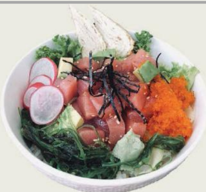
Tekka Don h,c,g,1,10

Flambierter Lachs, Flugfischkaviar auf Sushireis mit Ingwer, Sesam, Seetang Seared salmon, flight fish roe with sushi rice, ginger, sesame, and seaweed