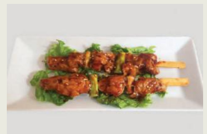
Yakitori g,j,c €6,00 焼き鳥

Frittiert Teigaschen mit Hühnerfleisch Fried Dumplings with chicken meat