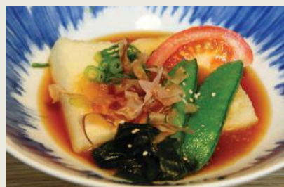
Agedashi Tofu c,h,j €8,50 揚げ出し豆腐

Paniertes Hühnerfleisch dazu Salat Fried chicken with salad