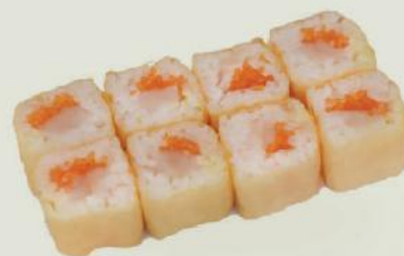
SP. Hotate Maki i,a,9 €7,50 ホタテ巻

Jakobsmuschel, Flugfischkavair, Mayo Scallop, fightfish roe, mayonnaise