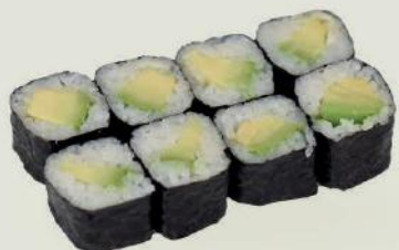
Avocado Maki €3,50 アボカド巻

Shitake Piz, Sesam/Shitake mushroom, sesame