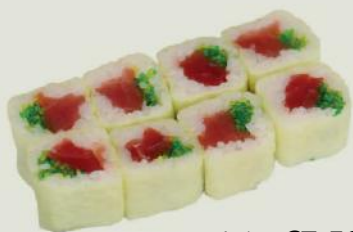
SP. Tekka Maki h,1 €7,50 鉄火巻

Thunfisch, Flugfischkavair Tuna, fight fish roe