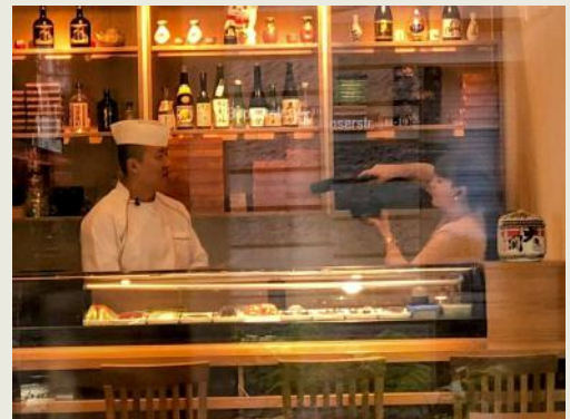
Chef in Interview

Wir heißen Sie im Restaurant Keyaki herzlich willkommen!