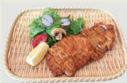
Chickenkatsu c,j €12,50 鶏カツ

Frittiert Mariniertes Hähnchenfleisch dazu Zitrone und Mayo/Fried marinated chicken meat with lemon and mayo