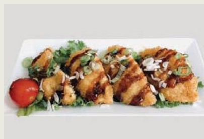
Age Gyoza g,j,c €6,50 揚げ餃子

Gebraten Teigaschen mit Hühnerfleisch Deep-fried dumplings with chicken meat