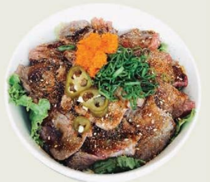
Gyu-Niku Aburi Don €17,50

Lachs, Gemüse mit Teriyaki-Soße auf den Reis Salmon, vegetable with teriyaki sauce and rice