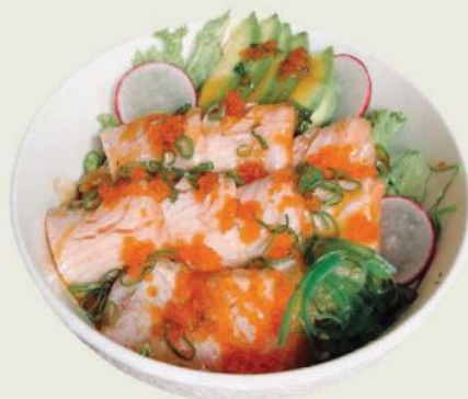
Aburi Shake Don €17,50