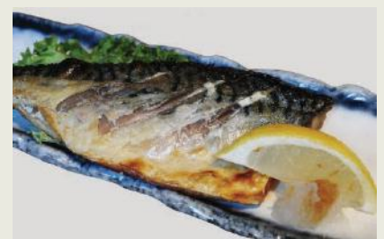
Saba Shioyaki h €16,50 鯖塩焼き

Frittiertes Tofu in Fischbrühe dazu Ingwer und Rettich Fried tofu in fish broth with ginger and radish