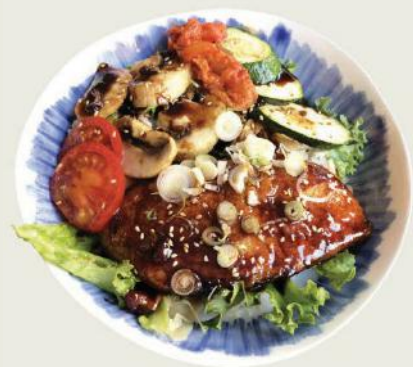
Shake Teri Don €17,50

Flambierter Verschiedene Sorten Fisch, Flugfischkaviar auf Sushireis mit Ingwer, Sesam, Seetang Seared mixed raw fish, flight fish roe with sushi rice, ginger, sesame, and seaweed