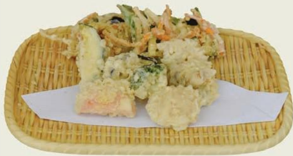
Yasai Tempura j,c 野菜天ぷら

Gemischte Gemüse Tempura Mixed vegetables tempura