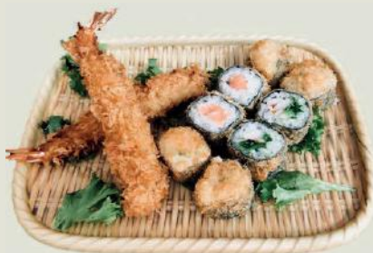
Age-Maki A i,h,g,c,1,10 €11,50 Frittiert/ Fried Maki 4 Lachs Maki, 4 Ebi Maki, 2 Ebi Fried