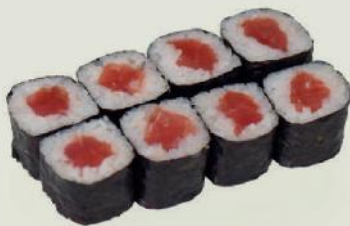
Tekka Maki h €5,50 鉄火巻

Thunfisch, Flugfischkavair Tuna, fight fish roe