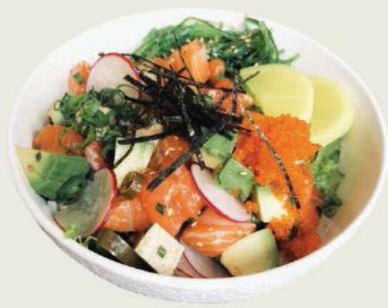
Shake Don h,c,g,1,10 €17,50