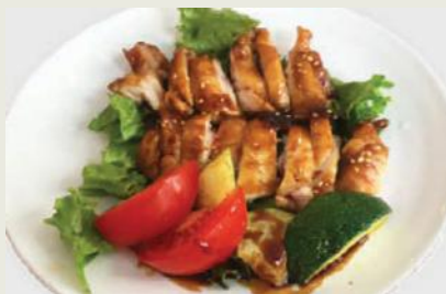
Chicken Teriyaki g,j,c €12,00 焼きテリヤキ

Geflügel-Grillspiechssen Grilled skewer of chicken served with yakitori sauce