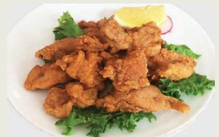
Tori Karaage j €9,50 鶏の唐揚げダ

Frittiert mariniertes Tintenfisch dazu Zitrone Fried marinated squid with lemon