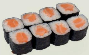
Shake Maki h €4,50 鮭巻

Jakobsmuschel, Flugfischkavair, Mayo Scallop, fightfish roe, mayonnaise