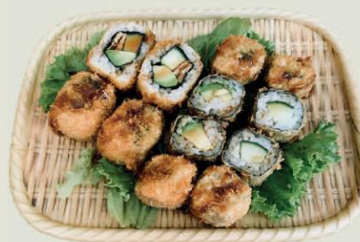
Age-Maki C g,c €11,50 Frittiert/Fried Maki 4 Kappa Maki, 4 Avocado Maki, 4 Veg. Uramaki