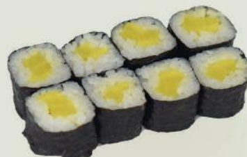
Shinko Maki 1,2,10 €3,50 新香巻