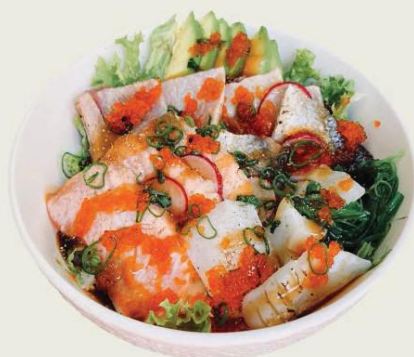
Mixed Aburi Don €17,50

Roher Lachs, Flugfischkaviar auf Sushireis mit Ingwer, Seem, Seetang Raw salmon, flight fish roe with sushi rice, rice, ginger, sesame and seaweed