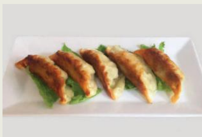
Yaki Gyoza g,j,c €6,50 焼き餃子

Gebraten Teigaschen mit Hühnerfleisch Deep-fried dumplings with chicken meat