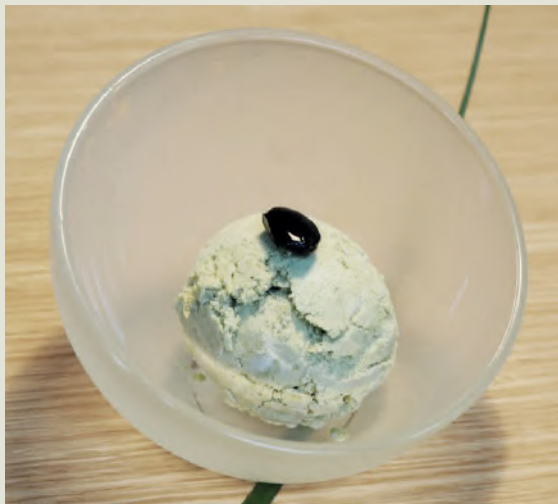
Hausgemachtes Eis Homemade ice-cream