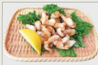
Ika Karaage c,j € 8,50 イカ唐揚げ

Hähnchen mit jap. Teriyaki Soße Chicken with teriyaki sauce