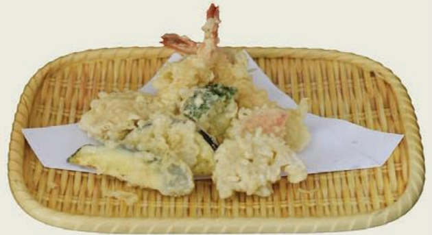
Mixed Tempura c,i 天ぷら合盛り

Garnelen, Tintenfisch, gemischte Gemüse Tempura Shrimp, Squid, Mixed vegetables tempura