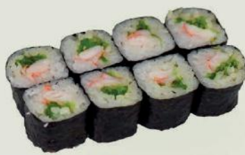
Ebi Maki i,j,g,1 €5,00 海老巻