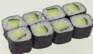
Kappa Maki €3,50 きゅうり巻