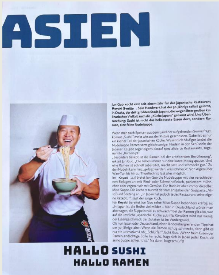
Chef in LIFT© Magazine