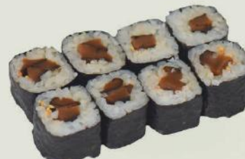
Shitake Maki g,c €3,50 しいたけ巻

Shitake Piz, Sesam/Shitake mushroom, sesame