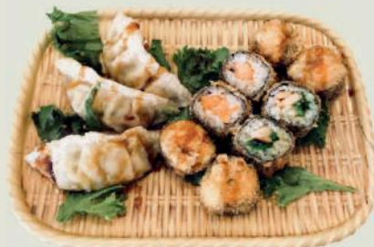
Age-Maki B h,c,g,1,10 €11,50 Frittiert/Fried Maki 4 Lachs Maki, 4 Ebi Maki 3 Gyoza